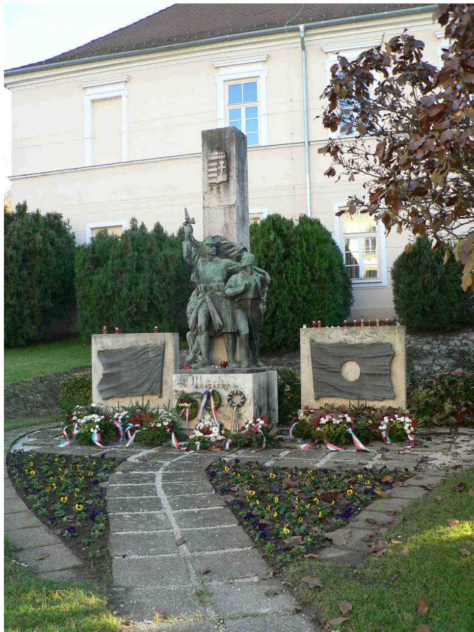
I. világháborús emlékmű

Parkosított zöldfelület szoborral. Jelenleg a településközpont vegyes terület része, átkerül zöldfelületbe.