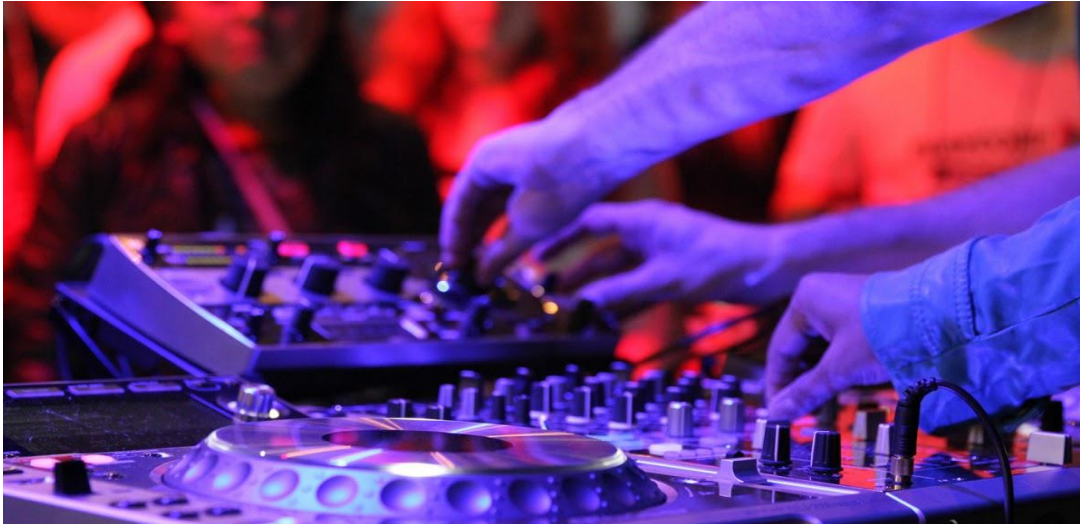
Cím: Fénykép , készítette: Ismeretlen a készítő, licenc: CC BY

Másik lehetőségként ott voltak a falusi búcsúi bálók a környező településeken, ahol egy kicsit más módon, de mégis szórakozhattak, táncolhattak a fiatalok. Illetve ez remek alkalom volt arra, hogy egy kicsit elegánsabb viseletben jelenjenek meg a férfiak, a nők pedig elővehették a csinosabbnál csinosabb báli ruhájukat, hiszen abban az időben is fontos volt a megjelenés mindkét nem számára.